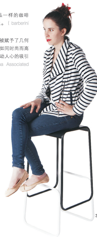
图6、7 Arachnide被赋予了几何形体与平滑曲线，如同时尚而高贵的融合，富有激动人心的吸引力。(Studioforma Associated Architects)