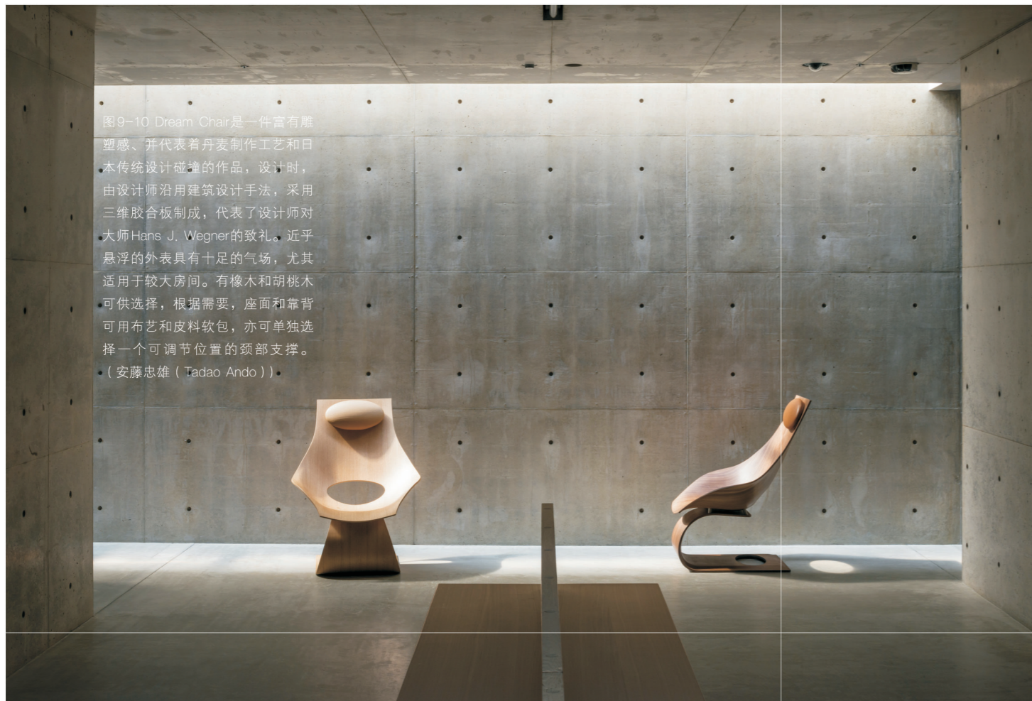
图9-10 Dream Chair是一件富有雕塑感、并代表着丹麦制作工艺和日本传统设计碰撞的作品，设计时，由设计师沿用建筑设计手法，采用三维胶合板制成，代表了设计师对大师Hans J. Wegner的致礼。近乎悬浮的外表具有十足的气场，尤其适用于较大房间。有橡木和胡桃木可供选择，根据需要，座面和靠背可用布艺和皮料软包，亦可单独选择一个可调节位置的颈部支撑。（安藤忠雄（Tadao Ando））。