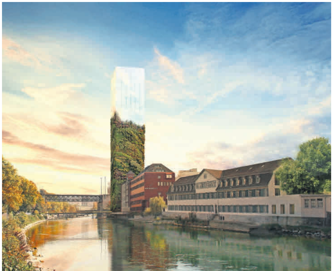
Auch so könnte er aussehen, der Swissmill-Tower in Zürich. Der im Original graue Betonklotz führt zu teils heftigen Diskussionen.

musste. 2011 genehmigten die Zürcher Stimmberechtigten mit 58,3 Prozent Ja-Stimmen-Anteil den Gestaltungsplan, der die rechtliche Grundlage für den Turm bildet. Abgelehnt hatte ihn nur der Kreis 10. Dort formierte sich schon früh Widerstand. Teile der Bevölkerung sehen im Silo einen unerwünschten Schattenspendler für die Badi Unterer Letten. fri